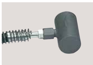
Цилиндрическая замораживающая головка для быстрой смены переходников.